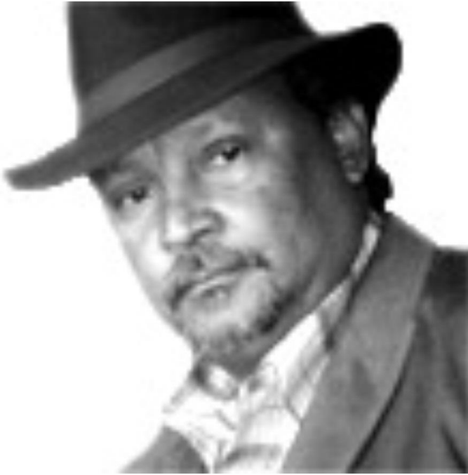
Photo shown here is the gallant Ethiopian fighter and author and poet Hama Tuma.

የመጨው ጊዜ መሪዎቻችን (ዕድሜ ከሰጠን) እነማን ናችሁ? ሲባሉ፤ የምትመሰርቱት የአገር አንድነትስ የስርዓቱ ስልት ምን ይመስላል፤ሲባሉ- እዛው ሳትደርሱ ምን ያደርጉላችኋል። ይሉናል። የሰሜን ሸፍቶች እጆቿን በካቴና አስረው አፏን በጨርቅ አፍነው አዘናግተው የጠለፏት ‘ጨረቃዋ ኢትዮጵያ’ እየታመጸች ከምትገኝበት ዝግ ቤት ነፃ ለማውጣት