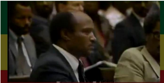
COL. GOSHU WOLDE - HISTORICAL SPEECH ON THE FATE OF ETHIOPIA AND ERITREA'S REFERENDUM

እስኪ ላንዳፍታ ወደ 1983 ግንቦት ወር ሕሊናችሁ መልሱት እና ለ22 ዓመት ተጉዛችሁ አሁን ወዳለንበት ፌርማታ/ማቆሚያ/ አተኩሩ። የደረሰብን ጥቃት ሊስቱ/ዝርዝሩ ስንት ገጽ ነው? ይህ ሁሉ ጥቃት ሲጫንብን የቆዳችን ውፍረቱ እና ቻይነቱ ለታዛቢ የሚገረም አይመስላችሁም። ጥቃታችን አንድንረሳ ተጃጅለን አንድንኖር እና ኢትዮጵያ በጠላቶች የተሸረበባት የባሕር ወደብ እገዳ ሕጋዊነት አንዳለው በማስመሰል ለኤርትራ ወንበዴዎች ዛሬም ጥብቅና የቆሙ ተቃዋሚዎች ስንመለከት አዲስ ውርደት ላይ ገብተናል። ለምን ዝም በሉ እንባላለን?!